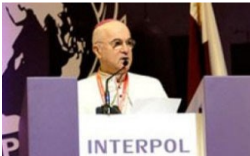
Hình trên : Người ký tên vào lá thư trên đây là ĐTGMục Carlo Maria Vigano, Sứ Thần Tòa Thánh tại Hoa Kỳ, ngài là người chuyển lá thư cấm tham dự vào các sự kiện Mẹ Du cho các GMục Hoa Kỳ, theo lệnh của

Đoạn trích dẫn lời Tuyên bố Zadar (đã bị trích dẫn sai lệch) lại là nền tảng duy nhất mà TBGLĐT sử dụng để biện hộ cho lý do tại sao không còn được phép tham dự vào các sự kiện Mẹ Du nữa. Trong đoạn văn tiếp theo của lá thư, TBGLĐT kết luận :