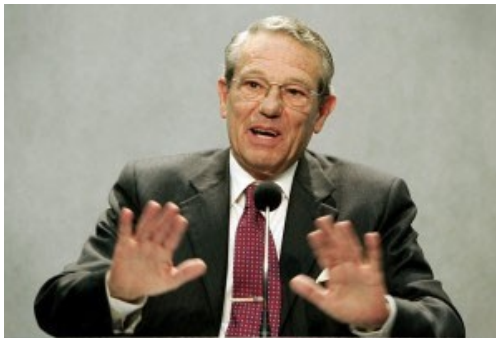
Tiến sĩ Joaquin Navarro-Valls, cựu Phát ngôn viên của Tòa Thánh Vatican.